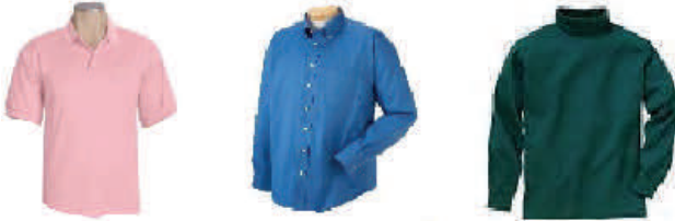
Estilo Polo manga larga o corta